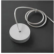
30721 Rosace Shanghai